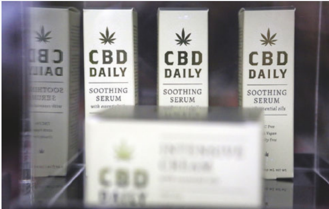
Nicht berauschend, aber auch nicht ohne: CBD-Produkte